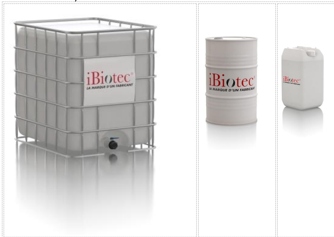
Nádoba 20 L

iBiotec® Tec Industries®Service Z.I La Massane - 13210 Saint-Rémy de Provence – France Tél. +33(0)4 90 92 74 70 – Fax. +33 (0)4 90 92 32 32 www.ibiotec.fr